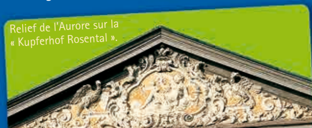
Relief de l'Aurore sur la « Kupferhof Rosental ».

Érigé en 1724 par le célèbre bâtisseur Tillmann Roland pour le compte de Johannes Schleicher comme site représentatif et doté d'une splendide porte de pont, la « Kupferhof Rosental » ⑥ compte parmi les ensembles les plus beaux de Stolberg.