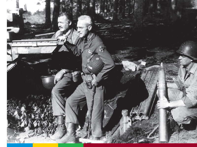
Ernest Hemingway und Colonel Lanham bei Schweiler, Eifel

In diesem Text ist nichts mehr von der Heroisierung des Krieges und des Mannesmuten zu spüren, für die Hemingway bekannt ist. Als der spätere Nobelpreisträger Anfang Dezember 1944 zurück nach Paris kam, war er wochenlang nicht ansprechbar und litt vermutlich an einer Lungenentzündung. Er kehrte nur noch einmal, während der Ardennen-Offensive, kurz an die Front