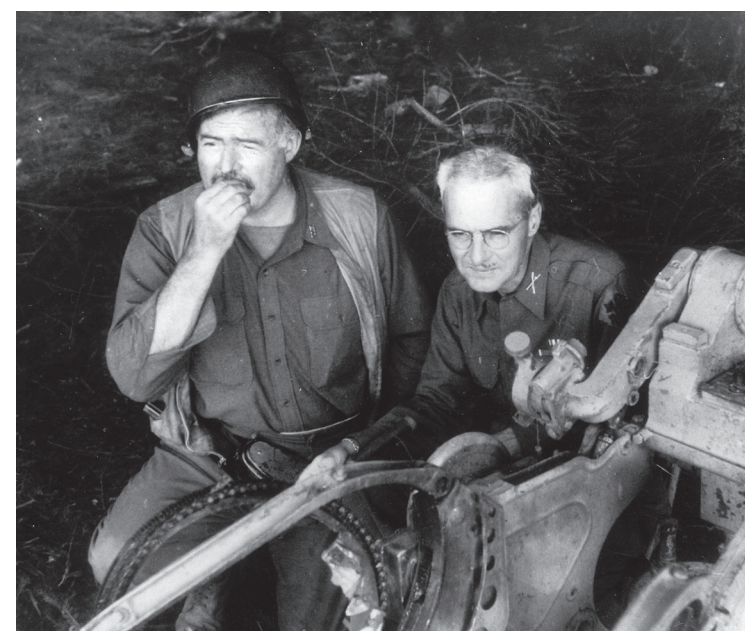
Hemingway und Lanham am Westwal

die Abwehr eines deutschen Überfalls weit hinter der Frontlinie durch einen Reporter hätte vor jedem Gericht der Welt als Notwehr gegolten.