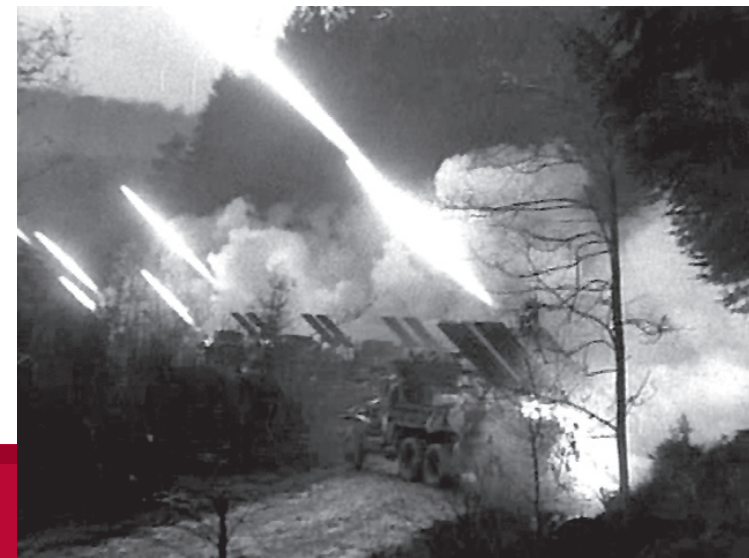
US-Raketenerwerfer im Hürtgenwald Nov. 1944