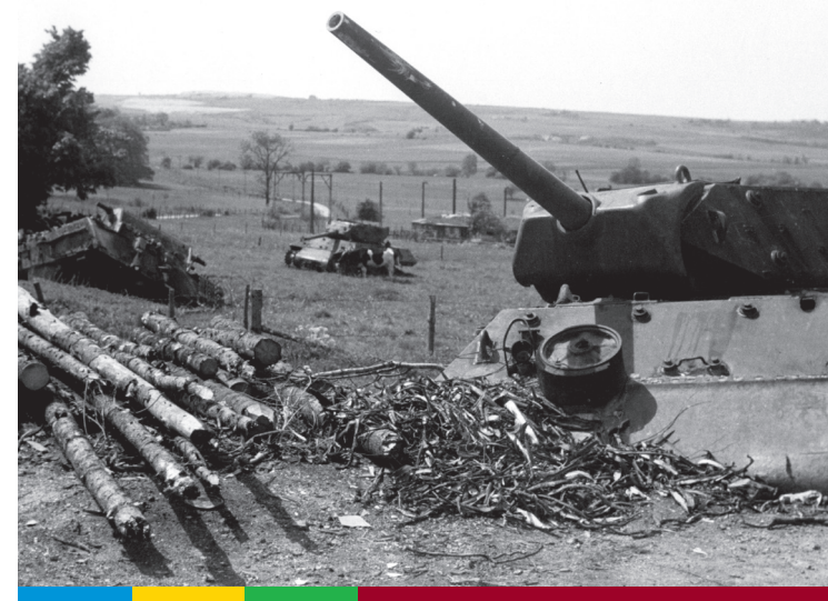
Panzerwracks in der Nähe von Hürtgen 1947

Ebenso verwunderlich ist, dass dieser Vorfall, der alle Insignien einer Hemingway-Story trägt – ein böser deutscher Hinterhalt im finsternen deutschen Märchenwald und die heldenhafte Verteidigung des Regimentsge-